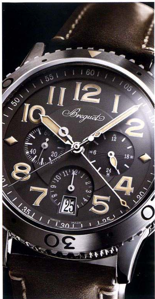
BREGUET Type XXI 3813

寶璣專為法國軍隊研製的Type XX是非常出名的軍用計時表，而Type XXI便是從Type XX發展而來的現代款式，具備飛返計時和日夜顯示之外，還擁有獨特的中央分鐘累計器，讓計時讀數更清晰。Type XXI 3813作為Only Watch的特別版，腕表首次採用名貴的鉑金表殼，直徑42mm，並配上專屬的啞光暗灰色表盤。