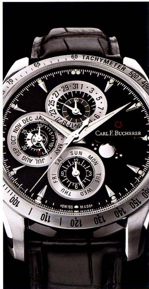
CARL F. BUCHERER Manero Chronoperpetual Only Watch 2015

寶璣專為法國軍隊研製的Type XX是非常出名的軍用計時表，而Type XXI便是從Type XX發展而來的現代款式，具備飛返計時和日夜顯示之外，還擁有獨特的中央分鐘累計器，讓計時讀數更清晰。Type XXI 3813作為Only Watch的特別版，腕表首次採用名貴的鉑金表殼，直徑42mm，並配上專屬的啞光暗灰色表盤。