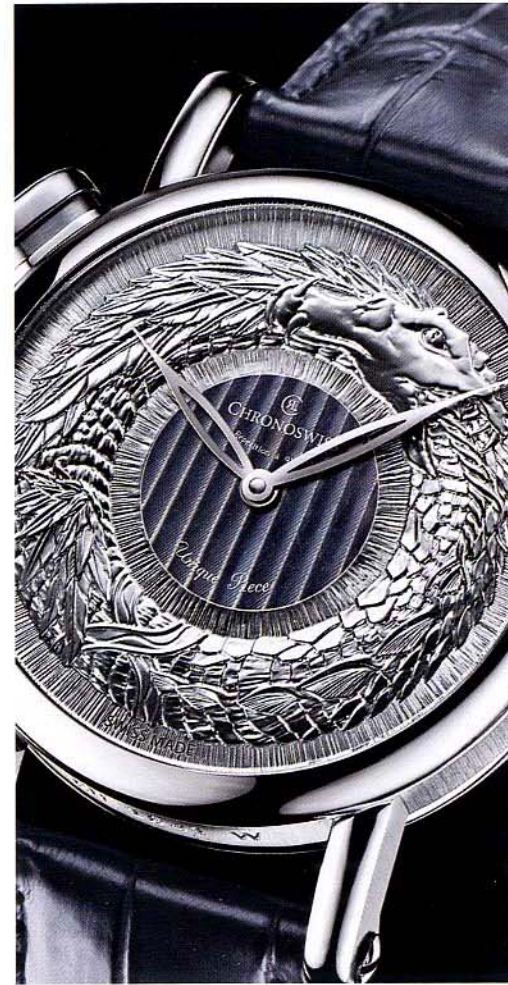
CHRONOSWISS "Ouroboros", Chronoswiss for Only Watch 2015

「Espoir & Paix」是希望與和平的意思， Christophe Claret 分別以表盤和表底的不同設計來表達這個主題。表盤中央以全息圖將內嵌象徵希望的綠寶石放大了兩倍，而反轉表底，則可看到透明底蓋的中央刻有Alfred Nobel的人像，以及在底蓋外圍刻有的129位諾貝爾和平獎得主的名字。