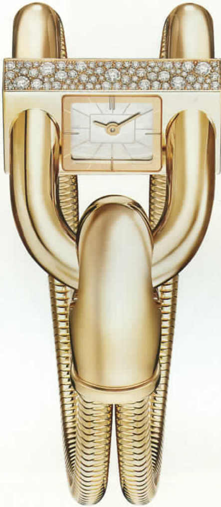
VAN CLEEF & ARPELS Cadenas